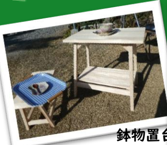
鉢物置台 サイドテーブルとして♪

☆ありがとうございました☆ 飲食店マップ掲載にご協力いただきました事業主の皆様、お忙しい中大変お世話になりました。マップの出来上がりまでもうしばらくお待ちください♪