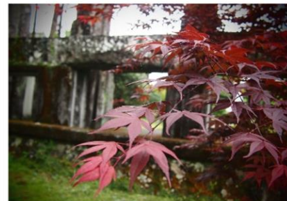
「百太郎溝入口のヤマモミジ」